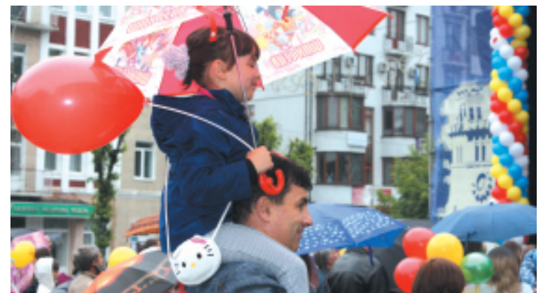
Попри дощ, дітлахам було весело і цікаво