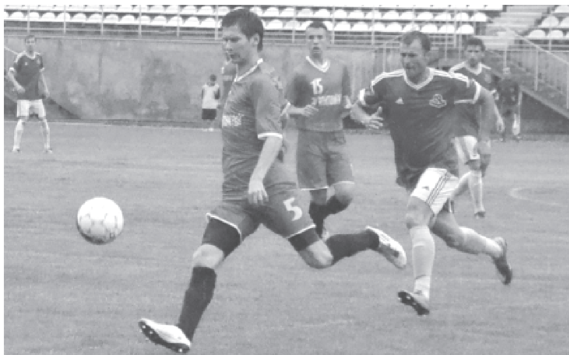
За 73 хвилини жодна з команд не розпечатала ворота суперника