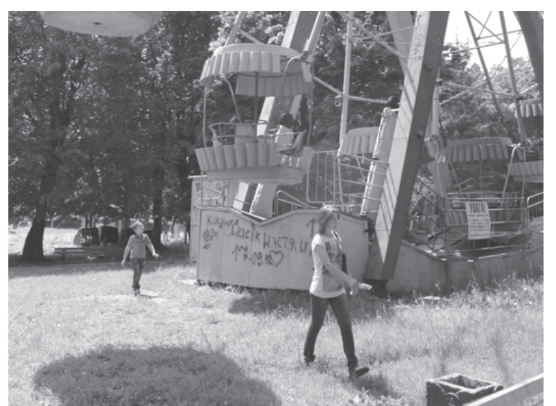
Жінка з дитиною проходить біля непрацюючого атракціону, не зважаючи на попередження

лист до міського голови з проханням безкоштовно передати колесо огляду приватним підприємцям в оренду. Тепер вони чекають рішення з Хмельницької міської ради.