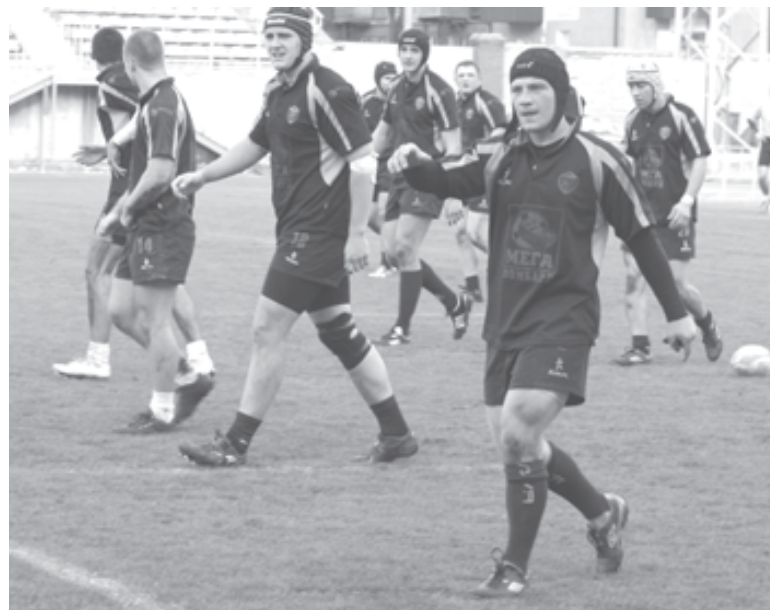
Хмельничани у підсумку отримали третє місце

У матчі за третє місце хмельничани зустрілися з київським клубом «Епоха-Політехнік», який теж був розгромлений у півфіналі, - 55:0. У малому фіналі «Оболонь-Університет» впевнено переграв київський