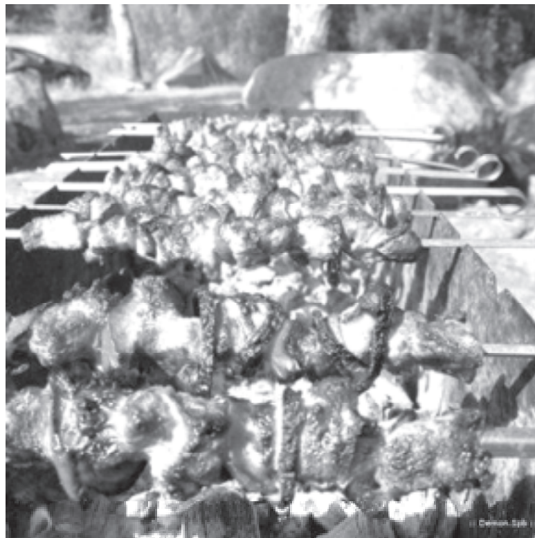
Спільний пікнік завершився трагедією