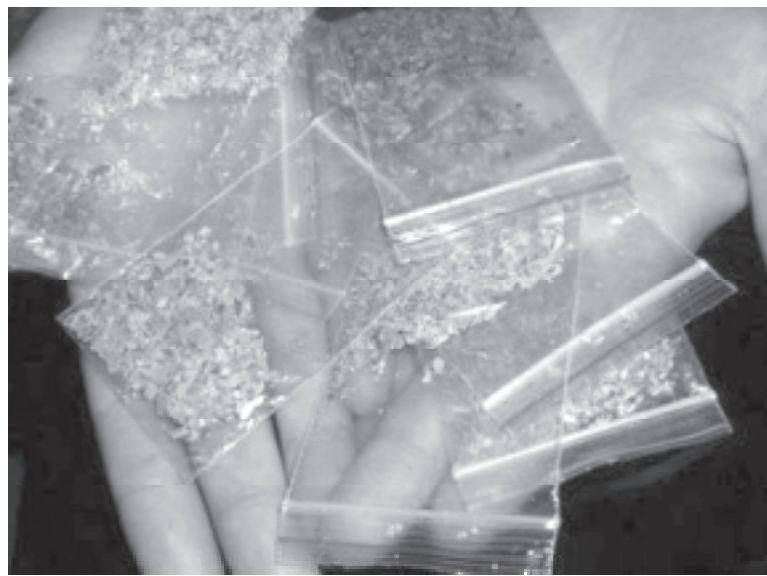
Суміші для куріння, які містять наркотичні речовини, заборонені в Україні

Стосовно студента відкрили кримінальне провадження за ознаками частини 2 статті 307 Кримінального кодексу України — незаконне виробництво, виготовлення, придбання, зберігання, перевезення, пересилання чи збут наркотичних засобів, психотропних речовин або їх аналогів.