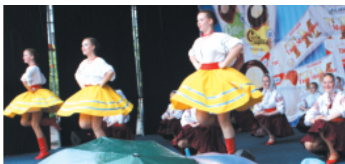
Святковий настрій гостям свята дарували творчі колективи міста