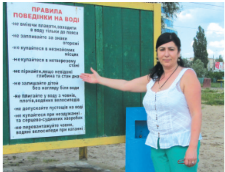
- Наочної агітації на пляжі також вистачає — є правила поведінки на воді, попереджувальні написи, інформація про екстрені служби, — каже адміністратор пляжу Анаїт Ділоян