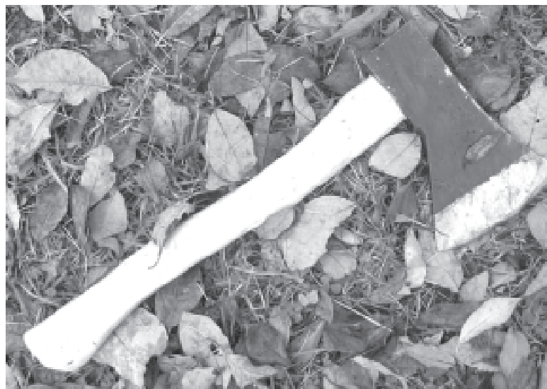
Старенький зарубав сина сокирою