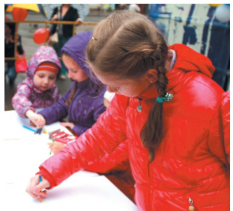
Юні художники із задоволенням малювали