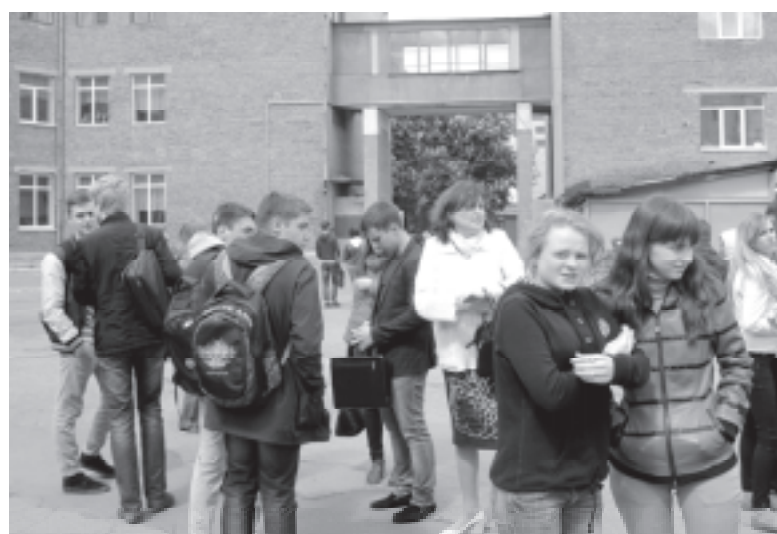
Школярам більше не заважатиме будівництво