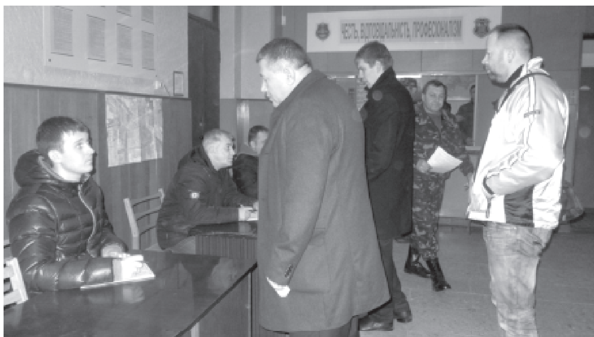
Під час часткової мобілізації у міському комісаріаті вишиковувалися черги добровольців різного віку. Служити ж у армії примусово юнаки не поспішають

- З усієї країни буде призвано 26 тисяч осіб, з Хмельницької області потрібно призвати 1650 юнаків – це дуже багато. І ми проводимо велику роботу в цьому плані, але коли буде-