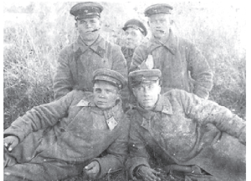
Червоноармійці Проскурова, фото листопада 1940 року

Коли німці 26 червня вийшли на ближні підступи до Кременця, 24-й корпус був все ще в 60 кілометрах від міста, здійснюючи марш в пішому строю. За цей час ситуація на фронті значно ускладнилась — гітлерівці були під Рівним, а 2 липня захопили Тернопіль. Вимальовувалася загроза просування противника до Проскурова та розгрому тилів. 24-й мехкорпус розвертають з Ланівців, куди тільки