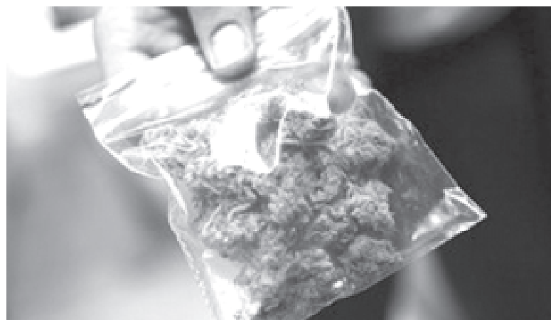
Наркоторгівця затримали під час збуту марихуани