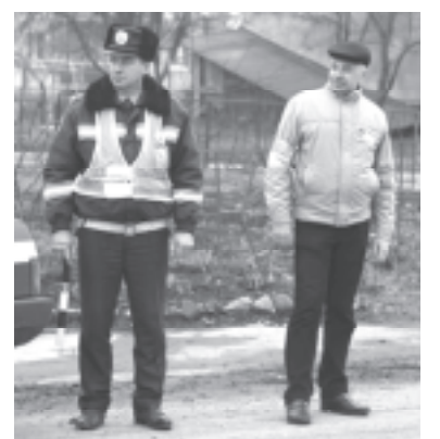
Першими в області легалізувалися самооборонівці з Полонного