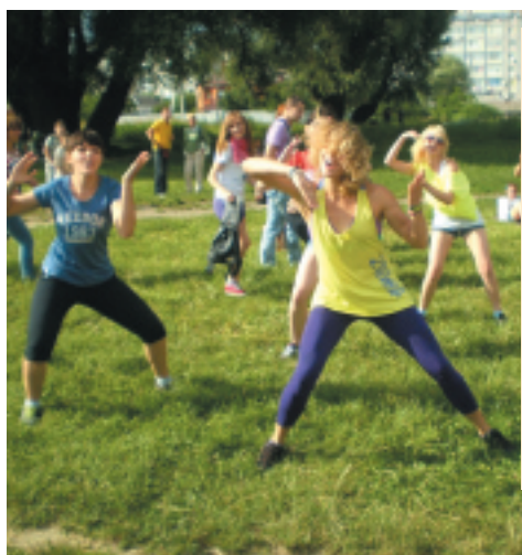
На фестивалі GreenFest проводитимуть майстер-класи з танцю

Довідка «ВСІМ»: «GREEN FEST» – це найбільший фестиваль розвитку на День молоді, що відбудеться 28 червня на території Молодіжного парку в Хмельницькому. Це 24-годинна програма з самого світанку, десятки заходів, майстер-класи, концерти, спортивні змагання.