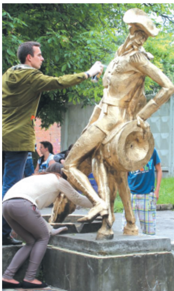
Старому пам'ятнику дали друге життя