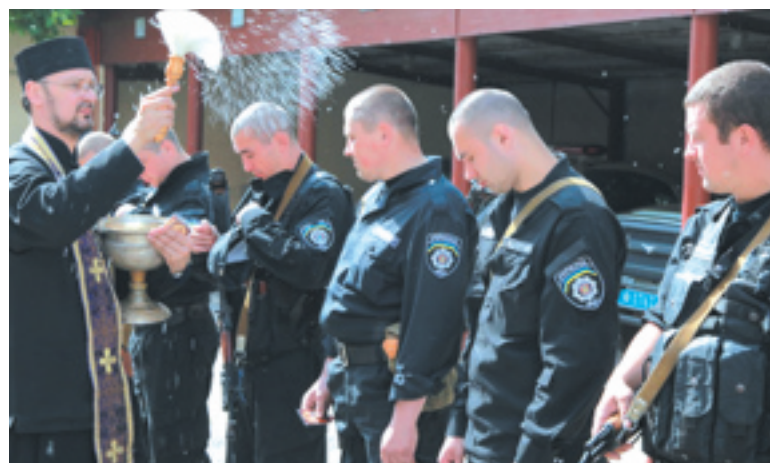
Перед від'їздом міліціонерів благословили

Правоохоронці роти міліції спецпризначення обласного управління міліції, яка раніше називалася «Беркут», вирушили на схід України. Хмельничани змінять своїх колег з Волині на блокпостах.