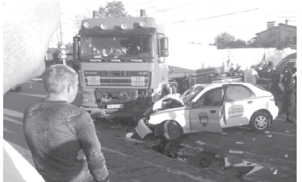
Внаслідок зіткнення вантажівки та легковика постраждали три правоохоронці.