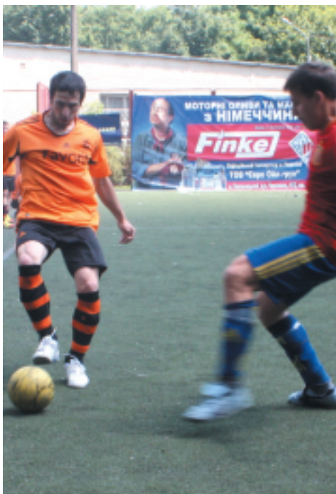
«Фаворит» (у помаранчевому) оформив вихід з групи

«Тандем» - «Фаворит» (4:9) Голи: Малков, Дідишен (2), Подлюк - Люхо-вель, Альміз (2), Савчук (4), Сироватко (2) «Інтерпродсервіс» - «Дантист» (2:7) Голи: Гарбар, Рауф - Кукурудза (3), Кузема, Розуман (2), Рудий «Еко-Альт» - «Тандем» (7:1) Голи: Бавренюк (2), Мокрота (2), Булка, Потюк (2) - Дідишен «Інтерпродсервіс», який лідував у групі після двох турів, потрапив у край неприємне становище. Розгромні поразки від «Фаворита» і «Дантиста» зменшують шанси команди на вихід з групи у разі. Тепер все залежить від ігор за участі їхніх прямих конкурентів. Першу сходинку очолив «Фаворит», який у матчі з «Тандемом» оформив впевнену перемогу. Останні у грі з «Еко-Альтом» втратили будь-які надії, тож матч з «фаворитами» ніяк не впливав на їхнє становище у турнірній таблиці. «Фаворит», розуміючи це, дозволив собі розслабитися, сподіваючись на легкі три очки. Та зверхнє ставлення до опонента мало не коштувало команді перемоги. «Тандем» дуже потужно почав і ще до середини першого тайму вів 3:0 у рахунку. Рятувати становище взявся Савчук, який ще до перерви оформив хет-трик і встановив паритет у матчі. До другого тайму «Фаворит» поставився значно відповідальніше, що і дало свої результати. Наразі стає зрозумілим, що «Фаворит» вихо-