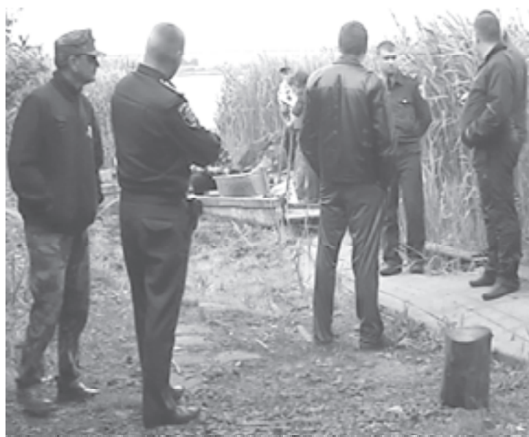
Незаконну рибалку припинили міліціонери та активісти