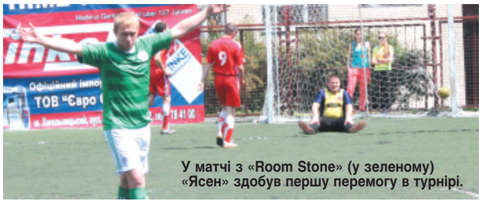
У матчі з «Room Stone» (у зеленому) «Ясен» здобув першу перемогу в турнірі.

голи престижу наприкінці матчу не вплинули на результат гри. У двобої між «Room Stone» і «Ясеном» переможцем був визначений вже після перерви. У першому таймі команди грали нарівно, що й підтвердив рахунок - 2:2. Однак гостям зі Старокостянтинова настільки потрібно було здобувати очки, що вони дописали «румстерів», забивши їм тричі. Це, до речі, перша перемога «Ясеня» у турнірі. У команди ще два матчі в запасі, оскільки у минулі вихідні через несприятливі погодні умови матч з «Фоззі» був перенесений.