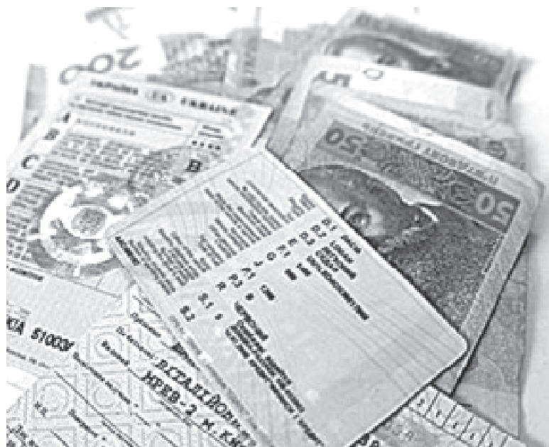
Правоохоронець користувався своїм службовим становищем