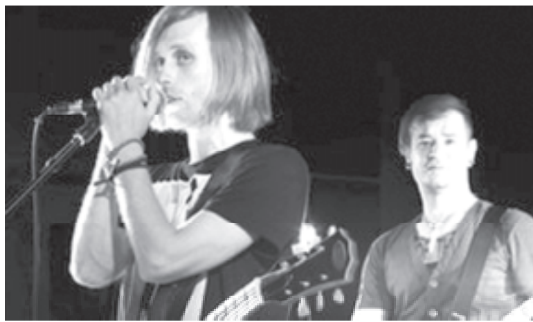
Хмельницький на фестивалі представлятиме рок-гурт «Безодня»

Цьогогоріч на відвідувачів фестивалю «Файне місто» чекають виступи відомих гуртів України, а також гостей з Італії та Швеції, наметове містеч-