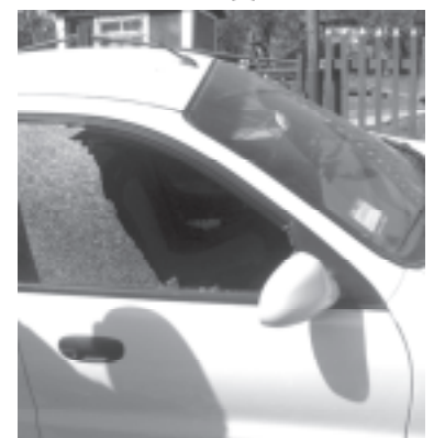
Викрадений автомобіль безхатченко залишив посеред дороги

Правоохоронці затримали зловмисника прямо посеред дороги, коли той прямував в напрямку обласного центру. Наразі він перебуває під вартою. Стосовно підозрюваного відкрито кримінальне провадження за частиною 1 статті 185 «Крадіжка» та частиною 1 статті 289 «Незаконне заволодіння транспортним засобом» Кримінального кодексу України. Наразі він перебуває під вартою. Йому доведеться